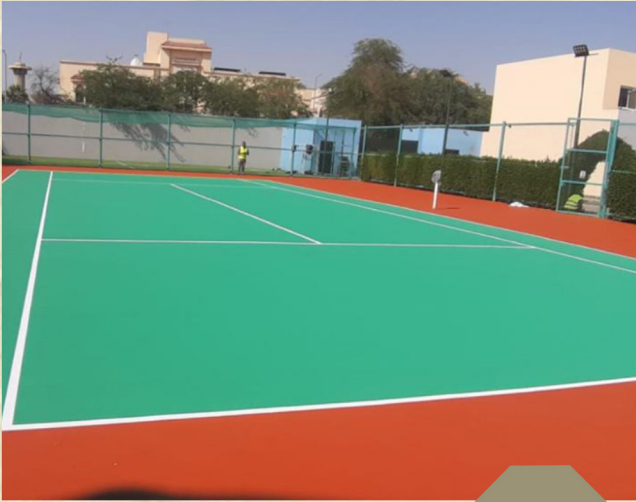
ملعب الطائره في حي الحمام كارولينا بالملز