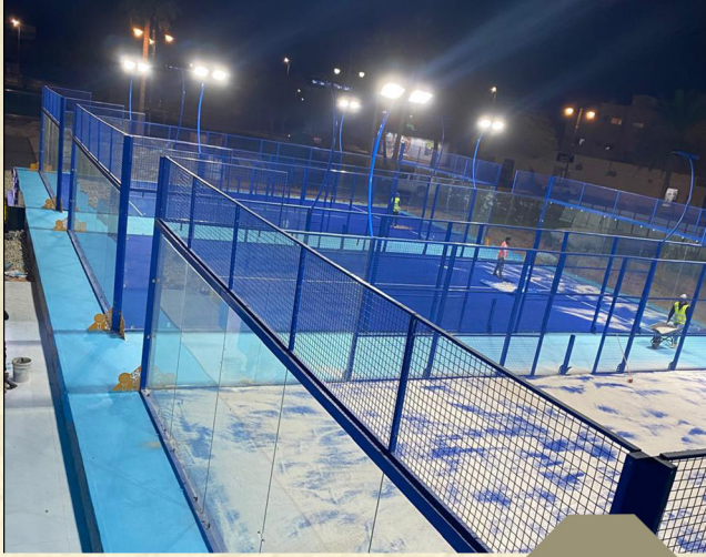
انشاء ملاعب بادل في بلدية عنيزة