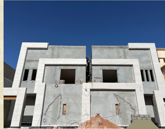
مجمع فلل النرجس