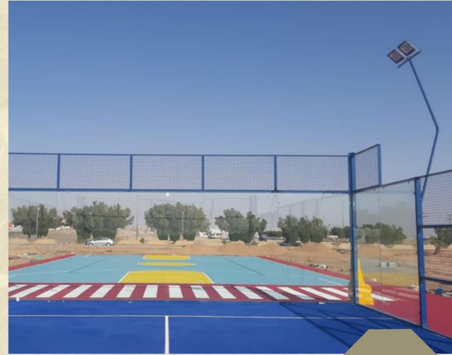
انشاء ملعب بادل وملعب متعدد في بلدية الدوامي