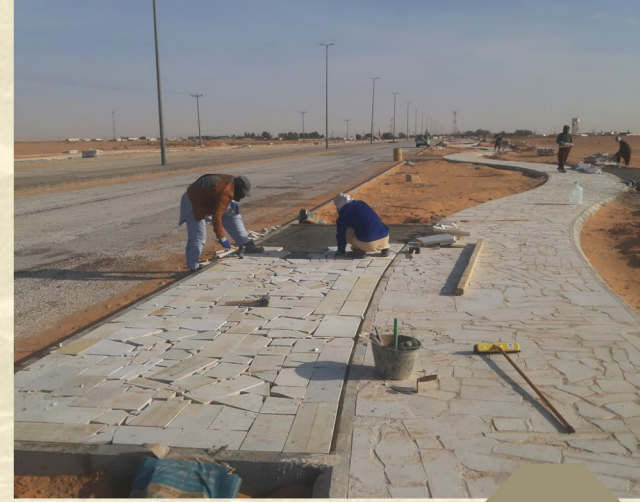
مشروع صيانه وتاهيل ممشى العمانيه - بلديه رماح