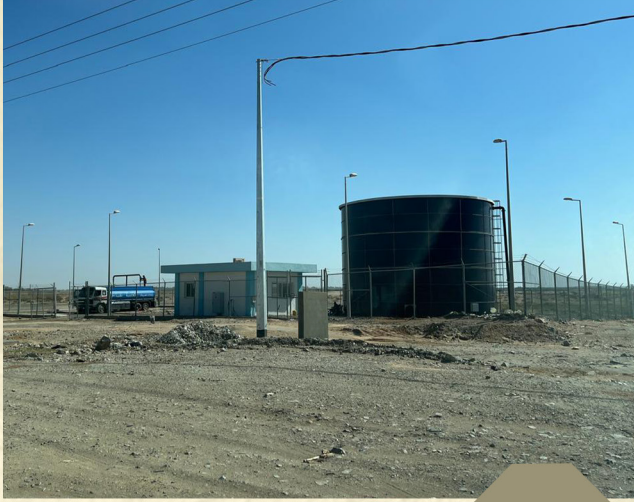
تنفيذ خزان وحمايه شركه المياه