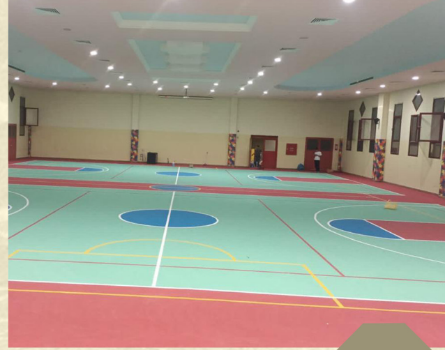
انشاء ملعب متعدد في مدارس الارقم