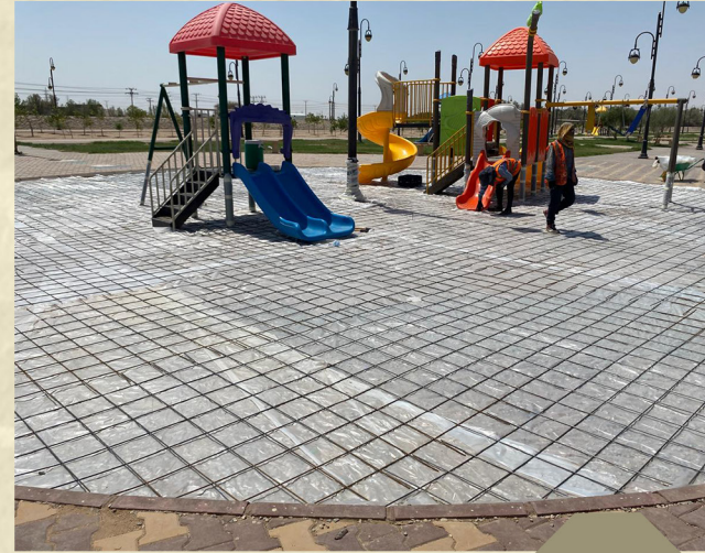
ارضيات مطاطيه في حديقته بلديه الدوامي