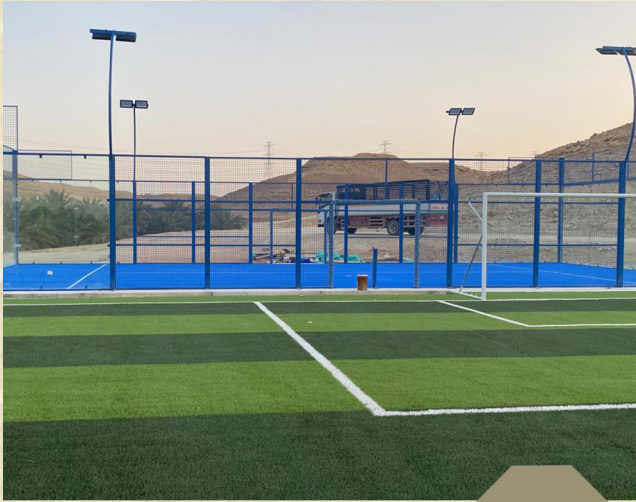
تركيب ملعب بادل وملعب كرة قدم في العيينة