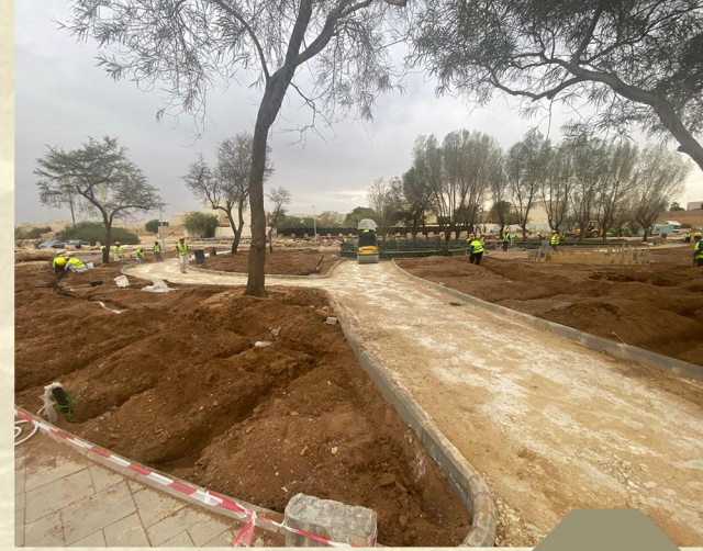
تاهيل وتطوير النهايات المغلقه في حي السفارات المرحلة الاولى الجهة الهيئة الملكيه لمدينه الرياض